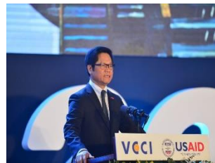
Chương trình cải thiện MTKD