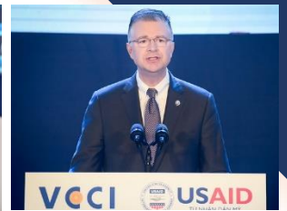
Hoạt động khác