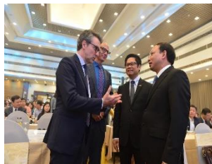
Tin nổi bật